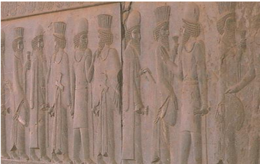
بزرگان پارسی و مادی در حال مهرورزی به یکدیگر، پارسه (تخت جمشید)

منابع گوناگون نشان می‌دهند که مادها و پارس‌ها همواره همبستگی داشتند. در نوشته‌های گزنفون اتحاد ماد و پارس به صورت روشن معلوم می‌شود؛ این موضوع در کتاب ۱، بخش ۵ کوروش نامه کاملاً هویدا است. از منابع یهودی هم نباید غافل شد. در کتاب دانیال از رویایی می‌گوید که در آن یک قوچ صاحب دو شاخ، سلطنت مادها و پارس‌ها عنوان می‌شود و بزی که آن را شکست می‌دهد پادشاه یونان (کتاب دانیال، باب ۸، آیات ۲۰ و ۲۱) در تخت جمشید به کرات حضور مادها و پارس‌ها را در کنار هم می‌بینیم. از جمله تصویر زیبای زیر که بزرگان مادی و پارسی در حال گفتگو و مهرورزی به یکدیگر می‌باشند.