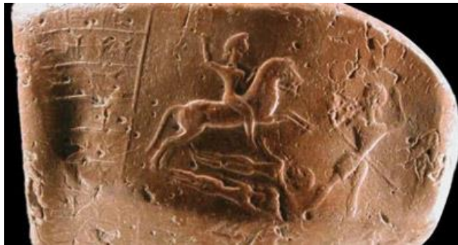
مُهر نشان مرتبط با کوروش یکم، پدر بزرگ کوروش بزرگ (منبع عکس: هنکلمن، ۱۳۹۱: ص ۱۰۷)

هر کس با تاریخ ایلام آشنایی داشته باشد، می داند که تمدن ایلام در حملات آشوریان ضربه شدیدی دید تا جایی که بسیاری از دستاوردهای تمدنی ایلام نابود شدند و بسیاری از ایلامیان کشته شدند. این اظهارات دروغین غیث آبادی در حالی است که ایلام دوباره در زمان هخامنشیان به شکوه رسید و آثاری مانند کاخ‌های شوش از ارزش مندترین آثار هخامنشیان می باشد؛ شوش یکی از مراکز مهم حکومتی در دوران هخامنشیان بوده است.