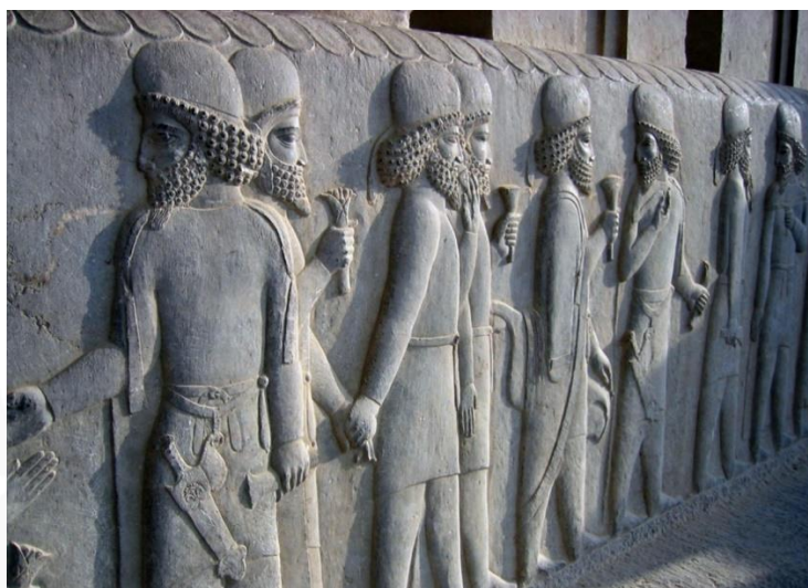
سپاه هخامنشی عمدتاً از سربازان مادی و پارسی تشکیل می‌یافت