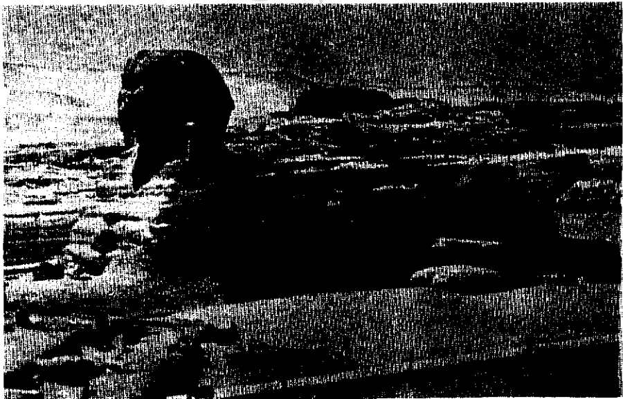
ابوالهول— ۲۵۵۰ قبل از میلاد

بزرگترین این اسباب بازیها مجسمه ابوالهول است. درباره ابوالهول مدتهای مدید سخنان بیهوده گفته شده است. گفته می‌شود رازی در این مجسمه نهفته است، درحالی که در واقع از یک تابلو ساده اعلانات بدیهی تراست. گفته می‌شود یک الهه است که از تمام رهگذران معتمایی می‌پرسید و وقتی نمی‌توانستند جواب صحیح بدهند آنها را می‌بلعید. هزار سال پس از ساختن این مجسمه یونانیان این داستان وحشت‌آور را ابداع کردند. و نیز گفته شد رازی در او نهفته است که وقتی تمام پیکره از زیرش درآید برملا خواهد شد. اکنون تمام پیکره را از شن جدا کرده‌اند. هیچ چیز تازه‌ای کشف نشده است؛ گُزیدن شیرمانند پهناورش که به طول ۶۳ متر روی شن صحرا