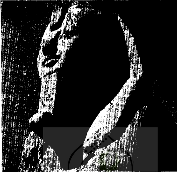
مجسمه هتشیسوت در ممفیس

هتشیسوت نیز مدعی تاج و تخت بود زیرا از خانواده سلطنتی بود. زنی بود زیبا و فتنه جو، جشن برپا می کرد، درباریان دور او جمع می شدند، و کسانی که از نفوذ زیاد کاهنان بر تحوطمس ناراضی بودند به زنش پیوستند و او خود را نایب السلطنه نامید.