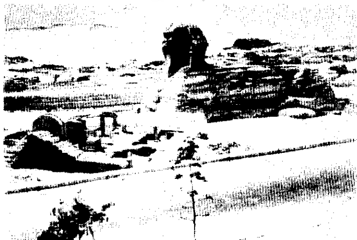
ابوالهول - ۲۵۵۰ ق-م