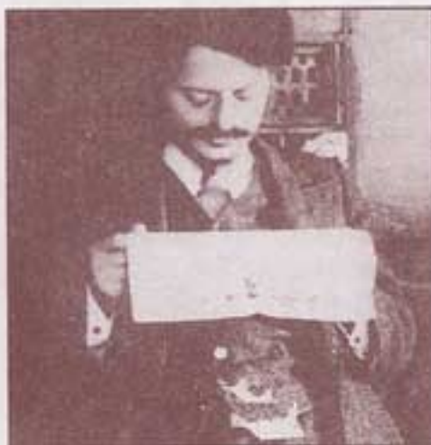
۱۹۱۳. اوضاع سیاسی روسیه بر وفق مراد تروتسکی است. او، به آینده‌ای که به پیروزی منجر می‌شود، فکر می‌کند.