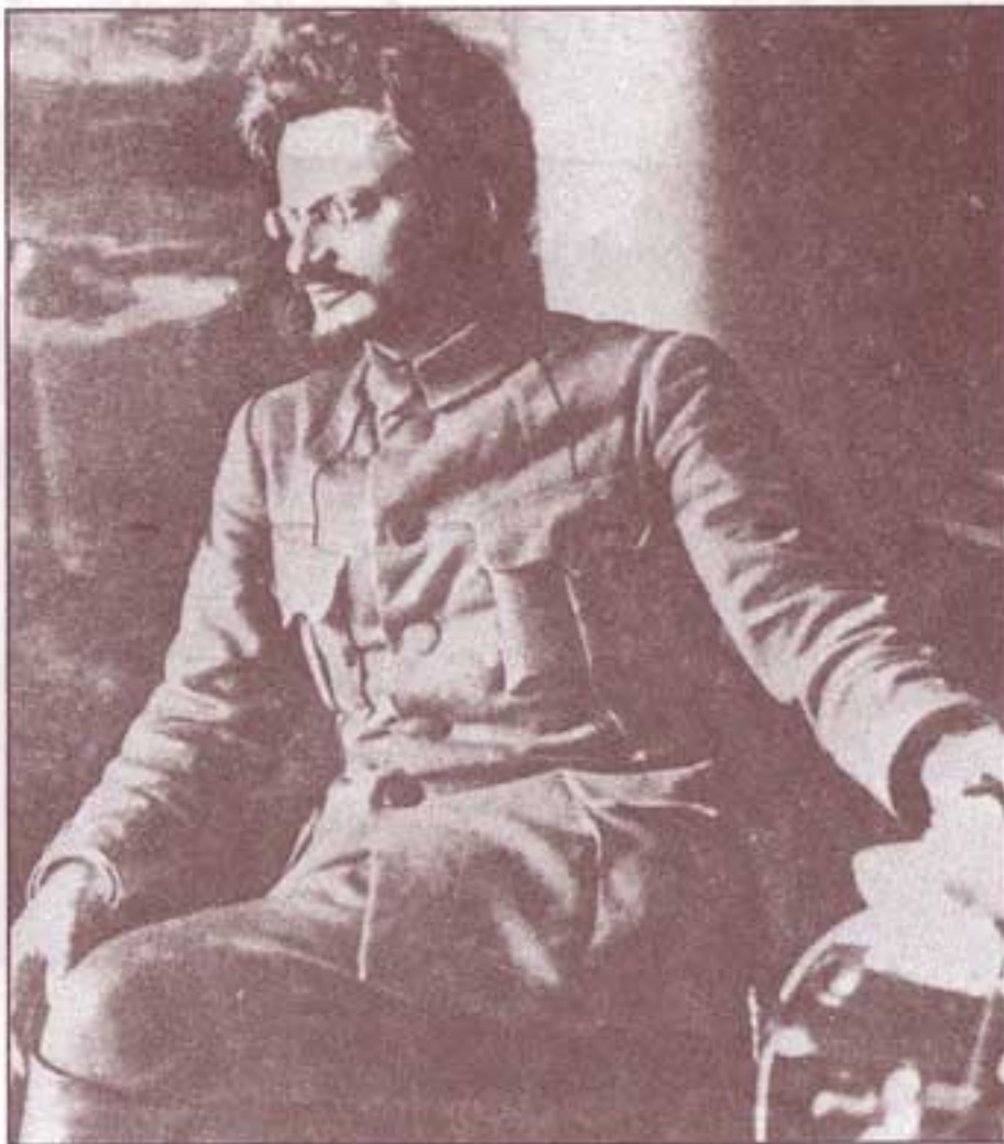
۱۹۲۰. تروتسکی اندیشه‌های نوین اقتصادیش را مطرح می‌کند.