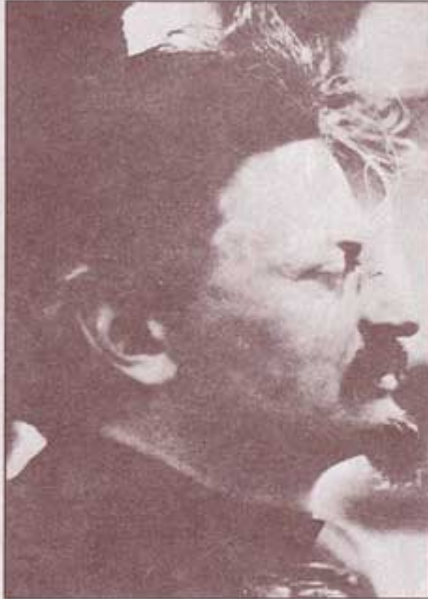
۱۹۲۱. در پایان سال، وضع جسمانی لنین وخیم می شود تروتسکی و لنین کمتر می توانند با هم تماس کاری داشته باشند.