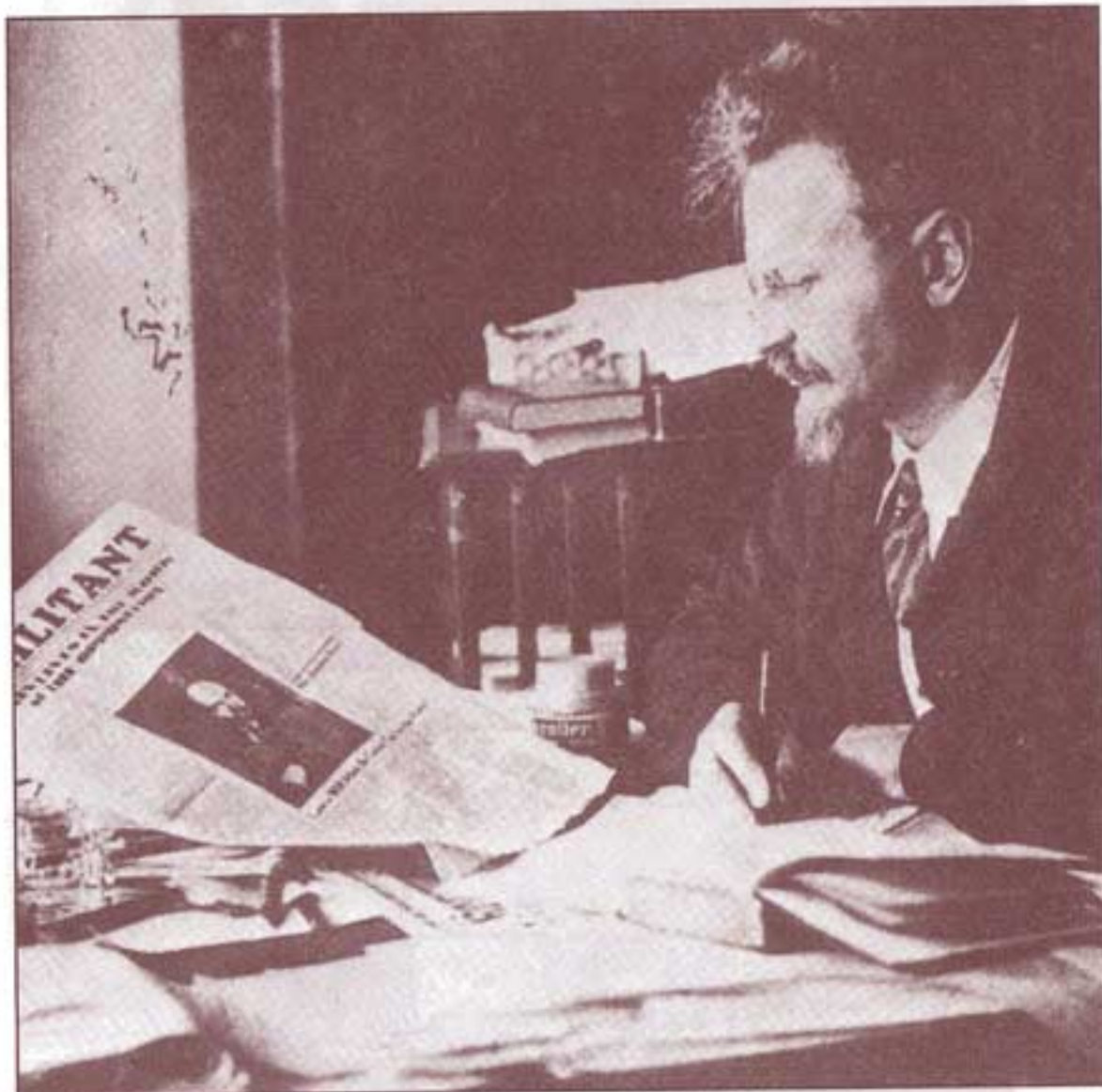
۱۹۲۹. ترکیه، پرین کیبو. تروتسکی در اتاق کار خود، وی کتاب «زندگی من» را در این اتاق نوشت.