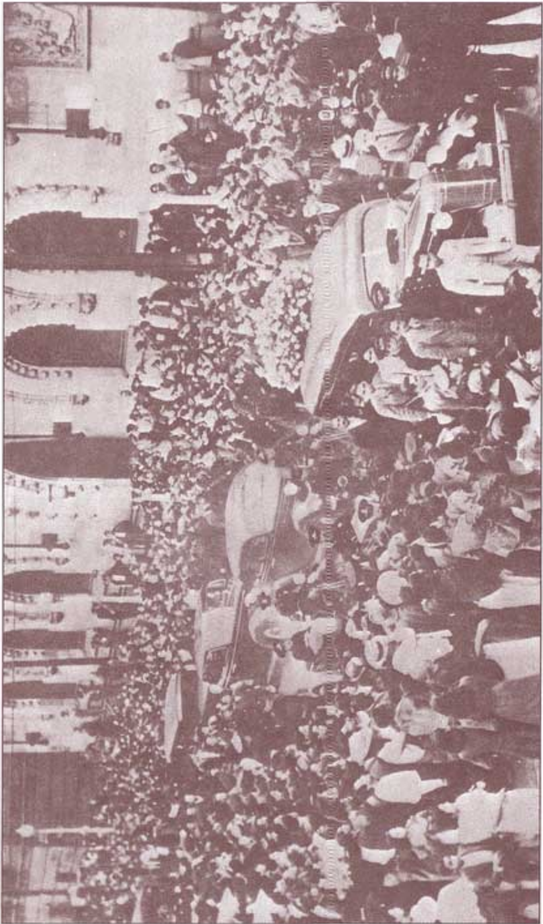
۱۹۴۰، ماه اورت، مکزیکو سیتی، تشییع جنازه تروتسکی.