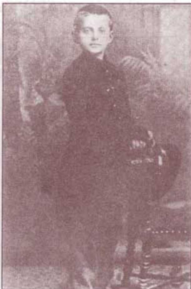
۱۸۸۸. تروتسکی در «اودسا» به مدرسه می‌رود.