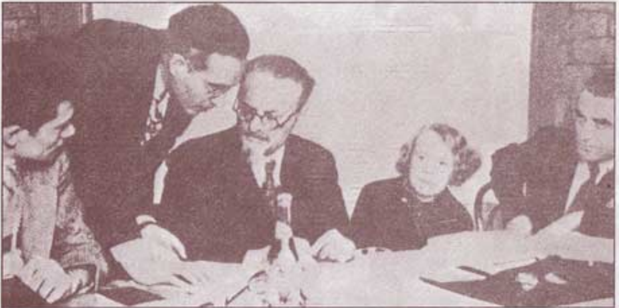
۱۹۳۹-۴۰، مکزیکو سیتی. استالین نه تن از رهبران انقلاب از جمله، کامنف، بوخارین، رادک را از سر راه خود برداشت. تروتسکی در تبعید، در کنفرانس‌های متعدد شرکت و به استالین اعتراض می‌کند.