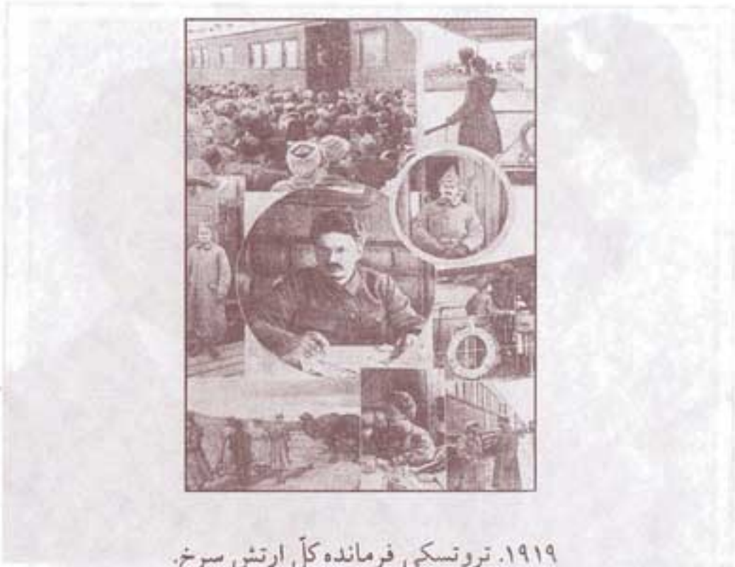
۱۹۱۹. تروتسکی فرمانده کل ارتش سرخ.