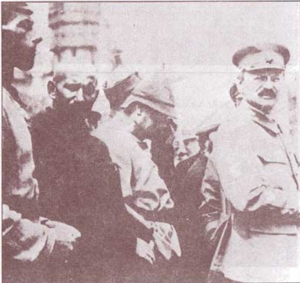
۱۹۲۰. تروتسکی در لباس فرماندهی کل ارتش سرخ الکسی رابکوف و ایمازمین در عکس دیده می شوند.