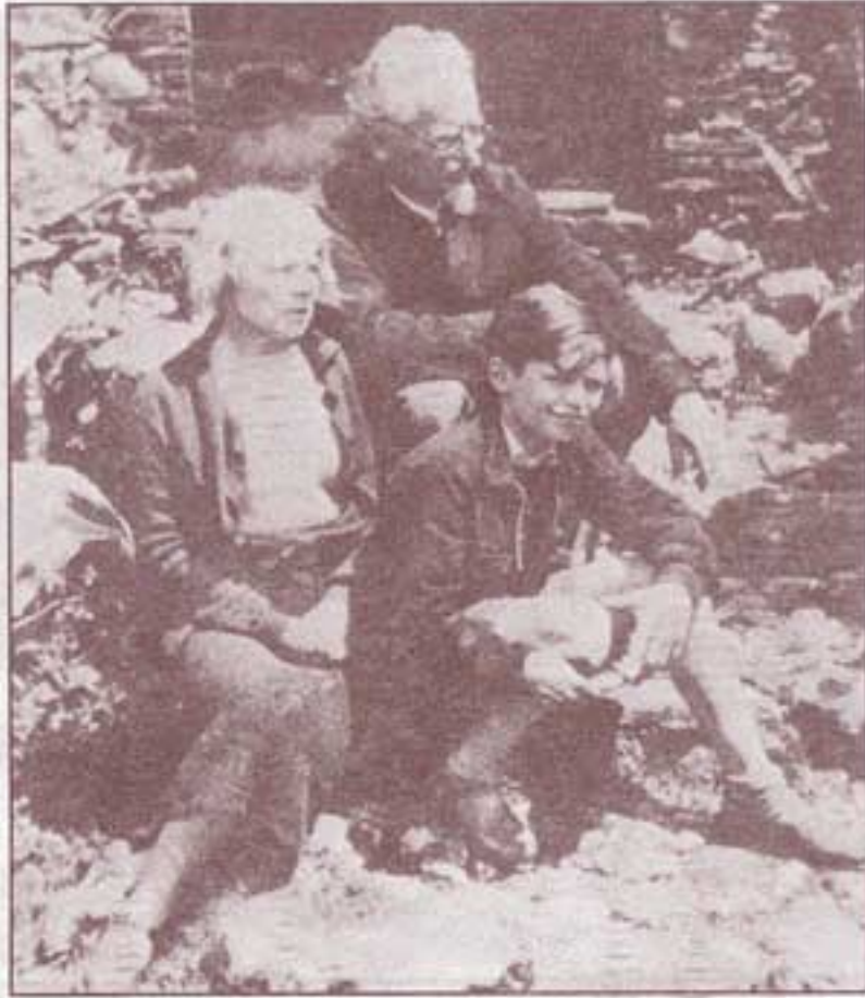
۱۹۳۹، مکزیکو سیتی. تروتسکی، سوا و ناتالیا.