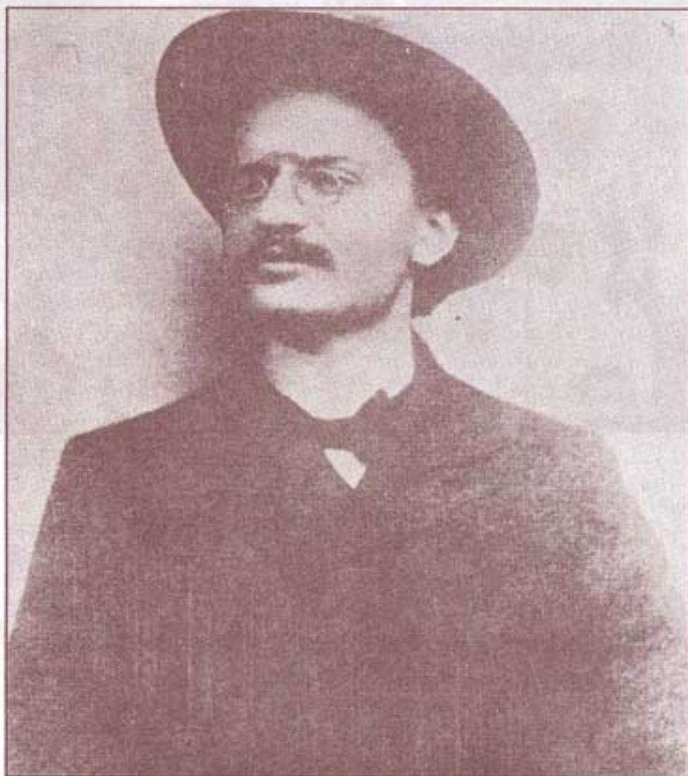
۱۹۰۷. تروتسکی پس از فرار از زندان.