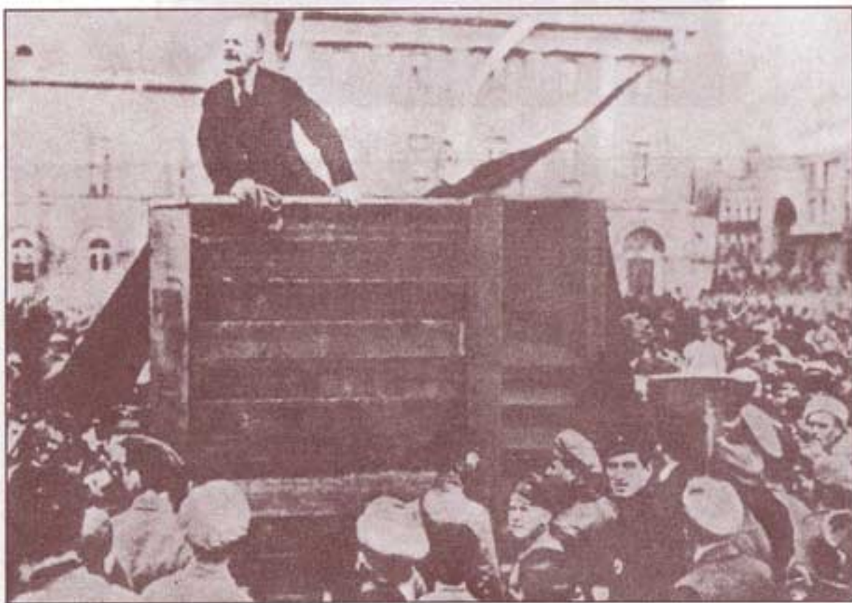
همان صحنه، همان تاریخ، به دستور استالین، تصویرهای تروتسکی و کامنف در فیلم رُتوش و حذف می‌شوند.