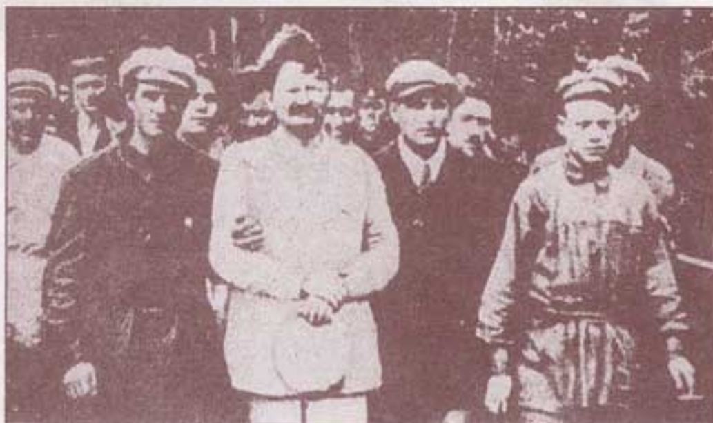
۱۹۲۸. آلمانا، مرکز قزاقستان، مأمورین گ. پ. او، ترونسکی تبعید شده را تحویل می‌گیرند.