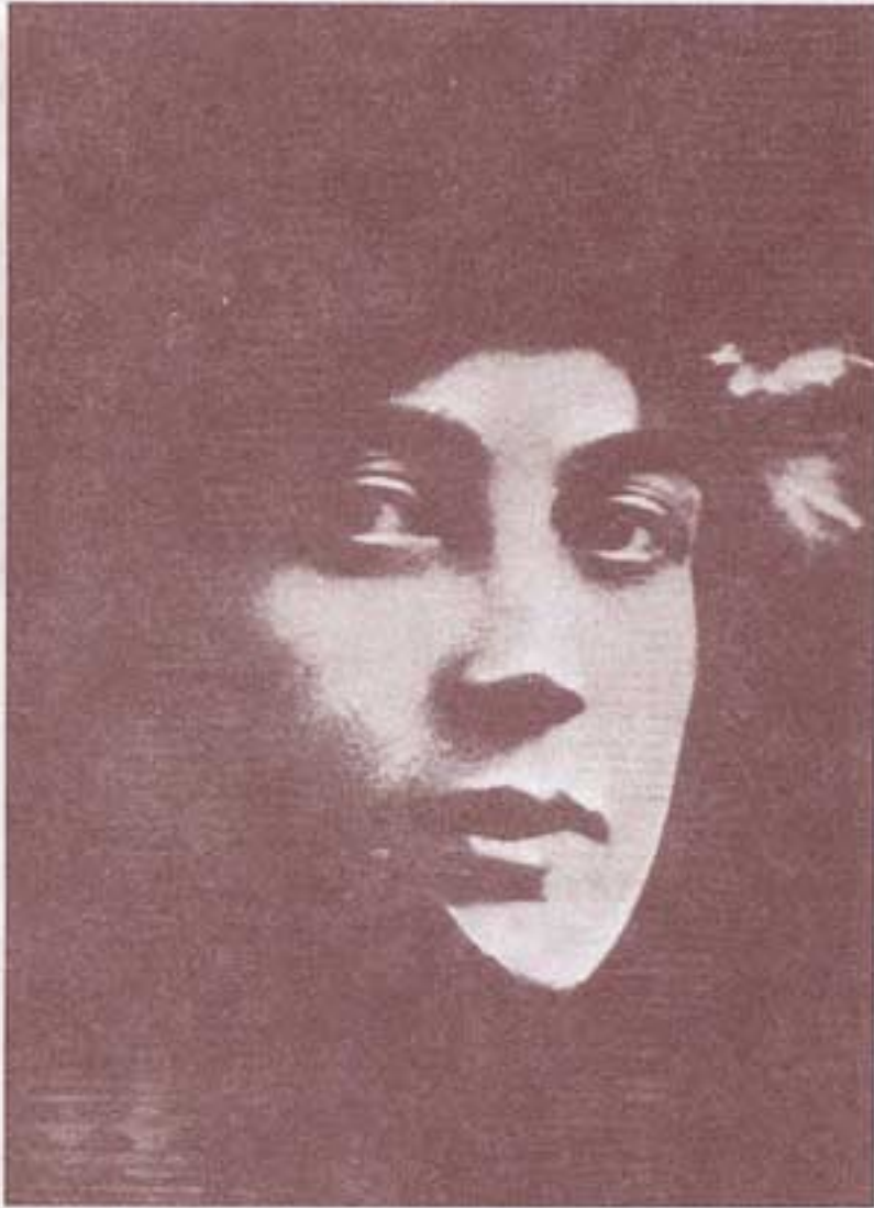
۱۹۱۵، پاریس. ناتالیا سروا، همسر دوم تروتسکی، که تا آخرین لحظه در کنار او بود.