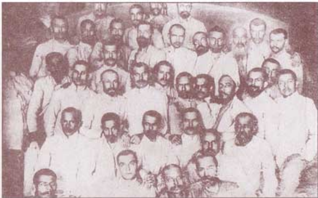
۱۹۰۷. شرایط زندگی تبعیدیان بسیار سخت است آنان خواهان رسیدن به حقوق مشترک هستند.