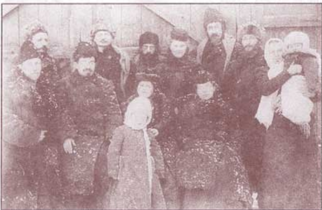
۱۹۰۷. تروتسکی همراه دوستان تبعیدیش.