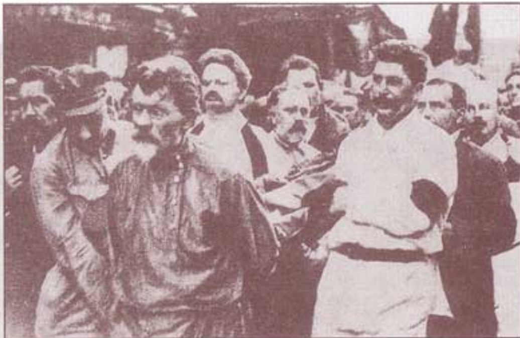
۱۹۲۶. ترونسکی و استالین، نابوت فلیکس دزرژینسکی را حمل می‌کنند.