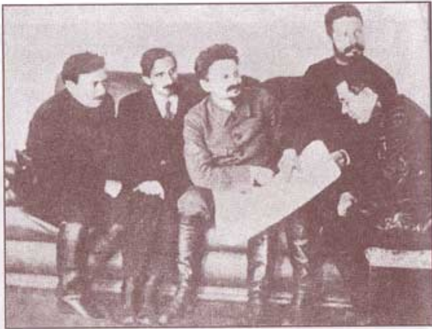
۱۹۲۰. روسیه در کشاکش جنگ‌های داخلی، از راست: