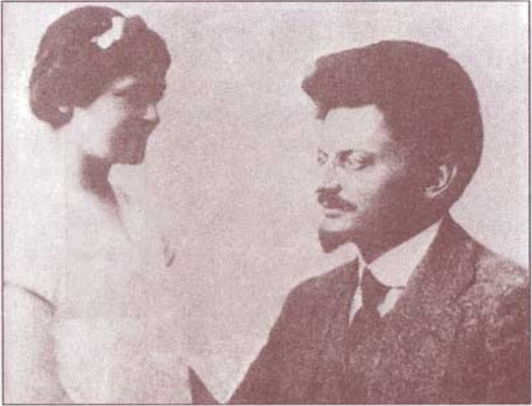
۱۹۱۵. خانواده‌ی تروتسکی همراه وی به فرانسه مهاجرت می‌کنند. تروتسکی و دخترش نینا در فرانسه.