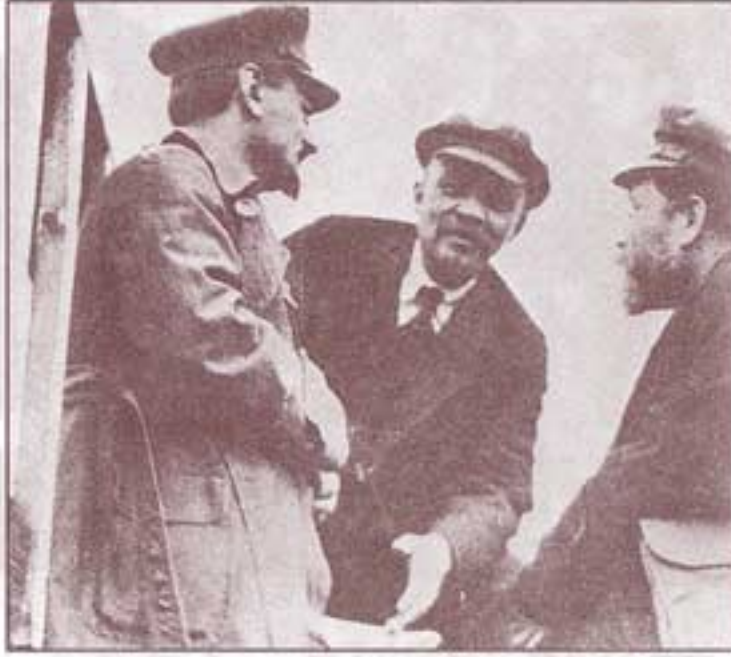
۱۹۲۰. کنگره دوم انترناسیونالیست؛ کامنف، لنین و تروتسکی سرگرم گفت و گو هستند.