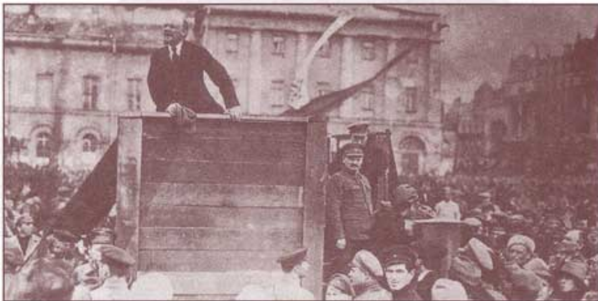
۱۹۲۰. پنجم مه، میدان سفردولف، لنین مشغول سخنرانی است، تروتسکی و کامنف در سمت راست تصویر، دیده می‌شوند.