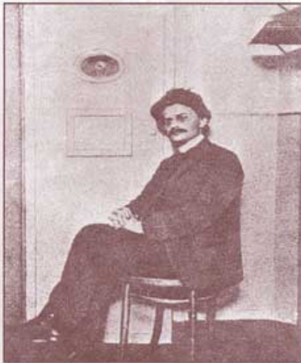
۱۹۰۶. ماه اوت، قلعه‌ی پیتروپول. تروتسکی در سلول انفرادی کوچکش آماده‌ی رفتن به دادگاه است.