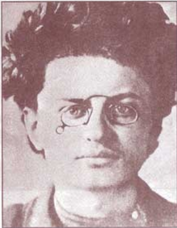
۱۸۹۹. تروتسکی در زندان «اودسا» کتاب‌های گوناگون مارکسیستی را مطالعه می‌کند و با تاریخچه و تشکیلات فراماسونری آشنا می‌شود.