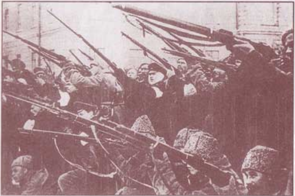
۱۹۱۷. اعضای گارد سرخ، تحت رهبری تروتسکی خود را برای حمله به قصر زمستانی آماده می‌کنند.