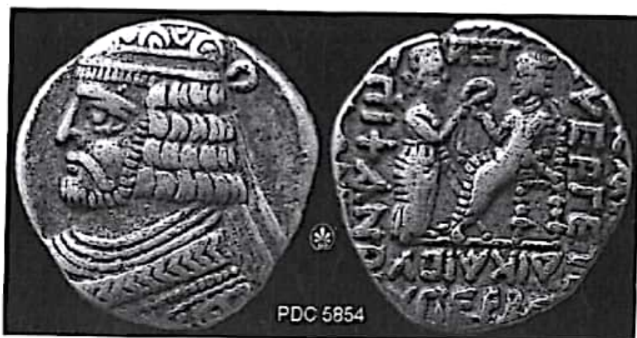
تصویر ۱۸- سکه وردان دوم. وی از ۵۵ تا ۵۸ م مدعی حکومت بود