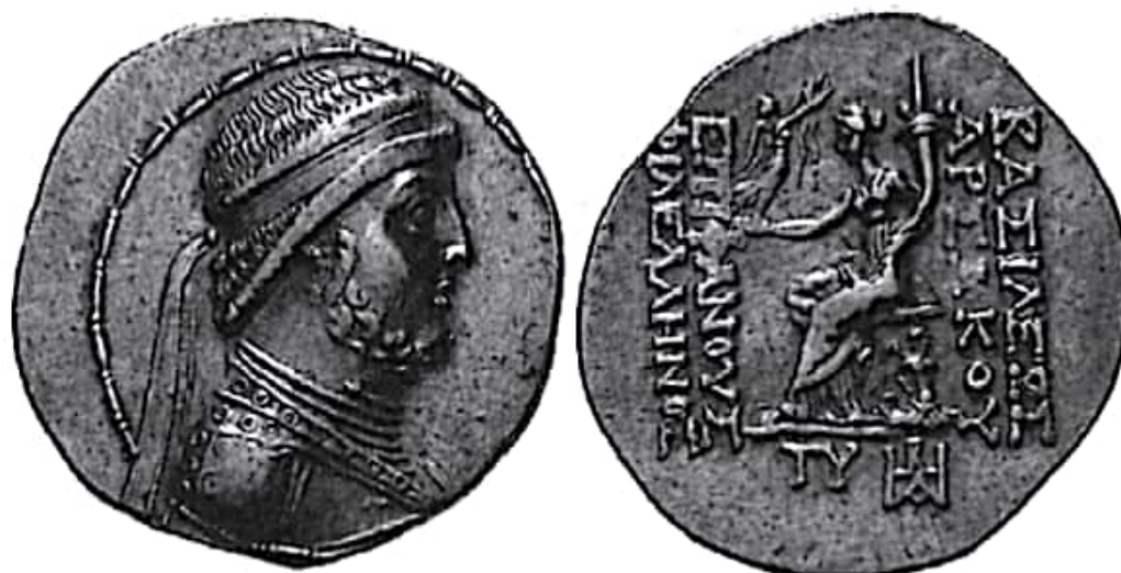
تصویر ۶- سکه مهرداد دوم ضرب سلوکیه دجله

مربوط به ماجرای هیمروس به شدت دچار ناآرامی شده بود، آرام سازد. سپس، بابل و خاراسن را نیز به متصرفات اشکانی افزود. همچنین موفق شد پس از یک نبرد موفقیت‌آمیز، پسر پادشاه ارمنستان را به‌عنوان گروگان نزد خویش برد. افزون بر این، بر میانرودان نیز تسلط یافت. مهرداد شاهان آدیابن و کردوبن را نیز مطیع ساخت (زرین‌کوب ۱۳۷۷: ۳۴۰). مهرداد دوم یکی از بزرگ‌ترین شاهنشاهان اشکانی بود. وی همه تلاش‌های سلوکیان را در جهت بازپس‌گیری سرزمین‌های شرقی از دست‌رفته خود در هم شکست و شاهنشاهی اشکانی را به شاهنشاهی یکپارچه و قدرتمندی تبدیل کرد. وی با روم تماس برقرار کرد و سکه تازه‌ای با شکل تازه برای خود زد. وی لقب اپیفانس، به معنی «تجلی خداوند»، برای خود انتخاب کرد. مهرداد دوم در اواخر دوران فرمانروایی، نفوذ خود را بر دولت ارمنستان افزایش داد.