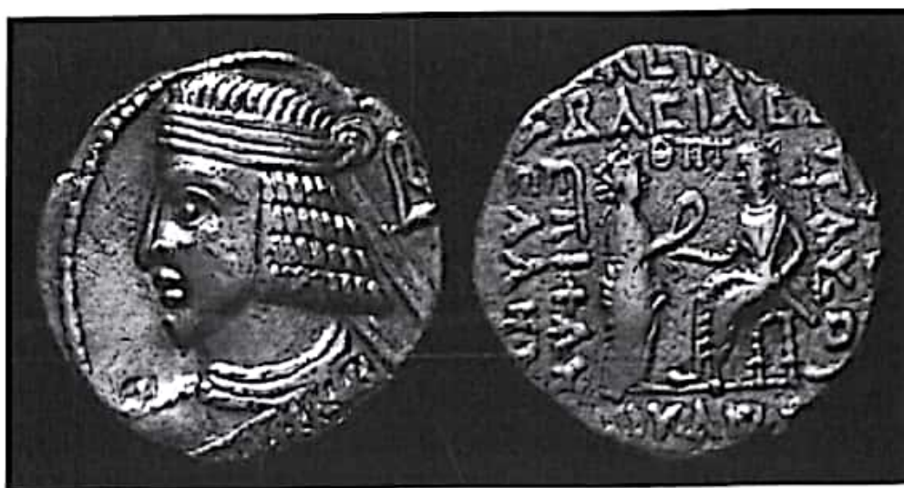
تصویر ۲۱- سکه پاکور دوم

بنابر آگاهی‌های به‌دست آمده از کتیبه‌ای بر روی برنز از هراکلس در سال ۱۹۸۴م، پاکور دوم پدر مهرداد اهل خراسن بود (السلیحی ۱۹۴۸: ۲۱۹). تصویر پاکور بر روی سکه‌هایش بدون ریش است.