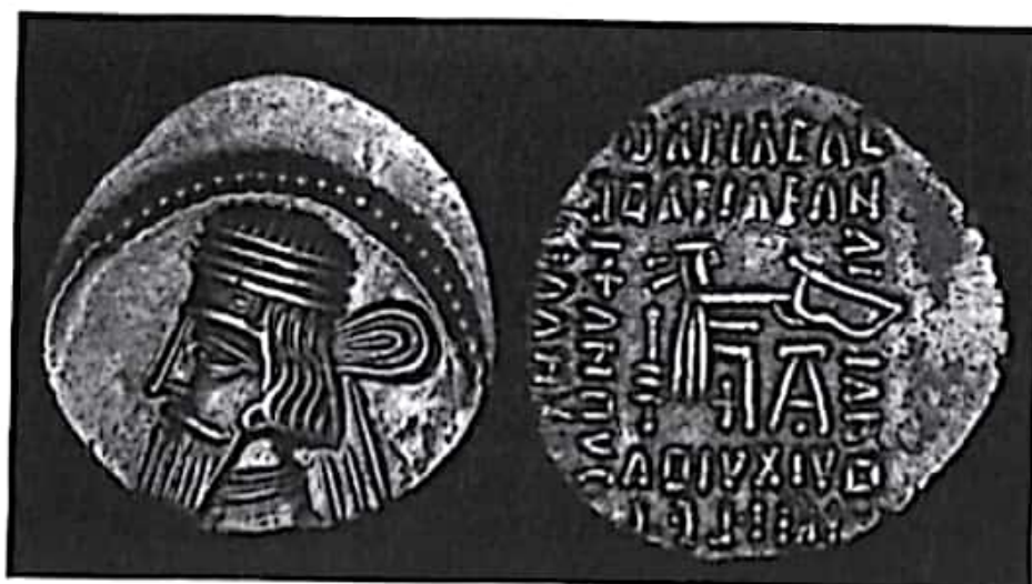
تصویر ۱۵- سکه گودرز دوم

سکه‌های وردان اول، به‌ویژه آنها که در شرق ضرب شده‌اند، ادامه همان سنت ضرب سکه‌های پدرش را نشان می‌دهند. سکه‌های نقره ضرب شده در بخش غربی شاهنشاهی بهتر باقی مانده‌اند. درهم‌های وردان اول، تنها سه گردنبند بر تاج شاه دارد؛ در حالی که بر تاج وردان دوم پنج گردنبند دیده می‌شود.