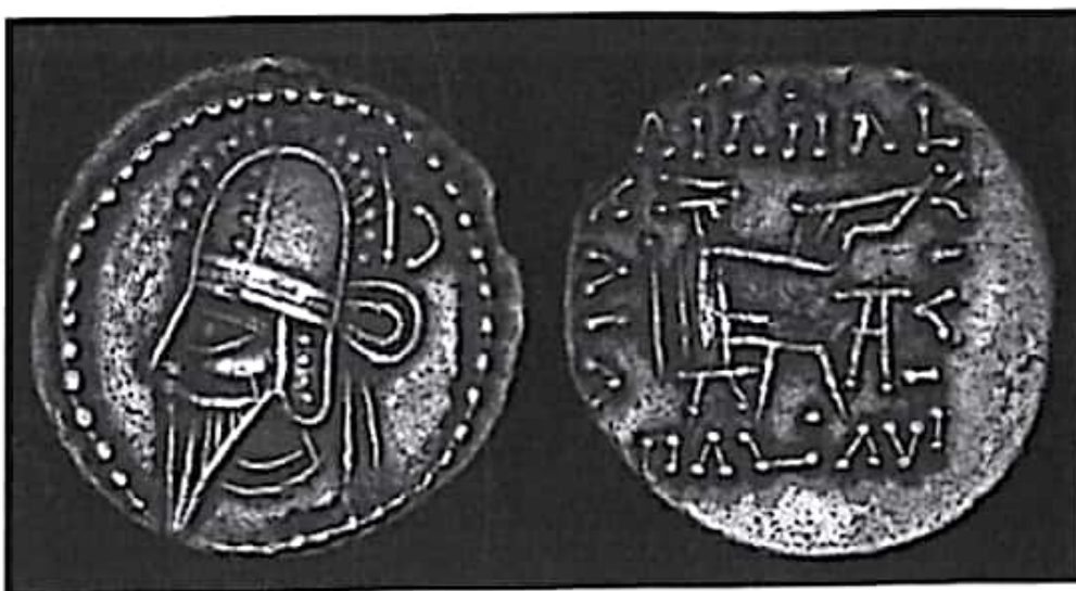
تصویر ۳۰- سکه بلاش ششم ضرب اکباتان

پس از مرگ بلاش پنجم، دو فرزند او، بلاش ششم و اردوان چهارم هر دو مدعی شاهنشاهی شدند و به نزاع برخاستند. سرانجام اردوان موفق به تسخیر ماد و پارس شد. ظاهراً سران و خاندان‌های این دو ایالت از بلاش حمایت نکردند. این جنگ و ستیز داخلی، سرانجام درخت شاهنشاهی اشکانی را که زمانی به‌مثابه درختی کهنسال و عظیم بود، از ریشه بیرون آورد. به‌طوری‌که گفته‌اند امپراتور جدید روم، آنتونیوس اورلیوس، مشهور به کاراکالا سقوط شاهنشاهی اشکانی را به سنای روم شادباش گفت. گزارش‌هایی که از این دوره باقی است، نشان می‌دهد بلاش ششم به دو تن از مخالفان دولت روم پناهندگی سیاسی داد. این رفتار بهانه‌ای به دست کاراکالا داد تا به تهدید ایران بپردازد. هرچند که بلاش سرانجام در اثر فشار برادرش و گروهی از نجبا ناچار شد آن دو تن مخالف دولت روم را به کشورشان مسترد دارد و از درگیری با روم بپرهیزد (ولسکی ۱۳۸۳: ۲۱۳؛ زرین کوب ۱۳۷۷: ۴۰۳).