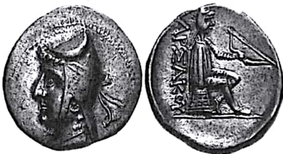
تصویر ۳- سکه مهرداد یکم ضرب هکاتوم پلیس

با زمان مندرج بر آخرین سکه او (سال ۱۷۴ سلوکی) یکسان است. با این همه پاره‌ای پژوهش‌های اخیر، تاریخ درگذشت مهرداد را ۱۳۲ ق م اعلام کرده‌اند. با توجه به نام مهرداد می‌توان با اطمینان اذعان کرد که ستایش ایزد مهر در این زمان در میان مردم پارت رواج داشته است (دبوواز ۱۹۶۸: ۲۷).