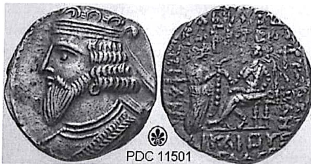
تصویر ۲۰- اردوان سوم ۱ (فرمانروایی ۸۰-۹۰م)

پژوهشگران دربارهٔ بلاش دوم آگاهی چندانی به دست نداده‌اند. شاید وی در این مدت سه ساله در بخشی از خاک ایران فرمانروایی می‌کرده است.