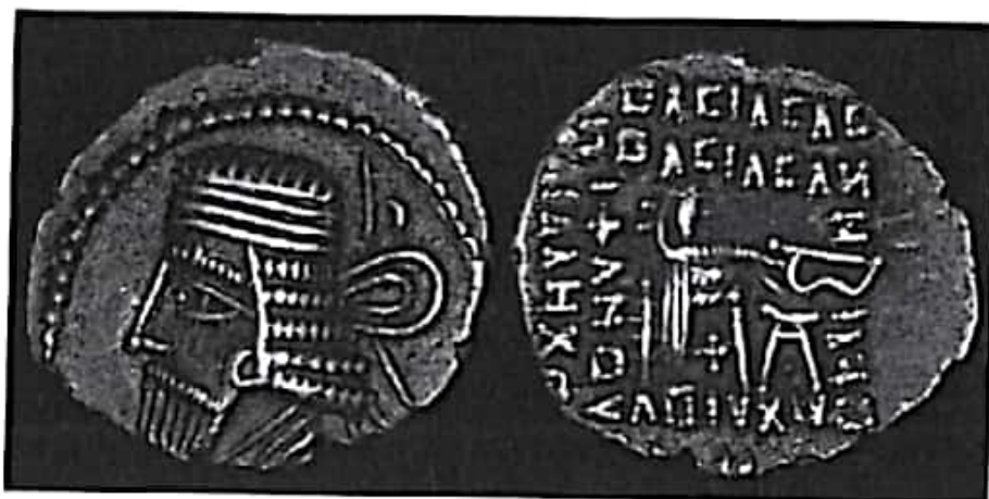
تصویر ۱۷- بلاش یکم

هخامنشی بود. زبان پهلوی را به جای زبان یونانی به عنوان زبان رسمی دربار اعلام کرد. نوشته‌های روی سکه‌ها که پیش از این به یونانی بود، به پهلوی درج شد. بنا بر کتاب ارزشمند دینکرد گردآوری اوستا نخستین بار به فرمان او انجام شد. بنای شهر بلاشکرد را به او نسبت داده‌اند. برای شناسایی او و سایر شاهان اشکانی نباید صرفاً به شرح جنگ‌های ایران و روم از زاویه دید نویسندگان رومی پرداخت؛ بلکه در این راستا، باید سایر تحولات فرهنگی را نیز در همان محدوده زمانی در نظر گرفت (ولسکی ۱۳۸۳: ۱۹۵-۱۸۳).