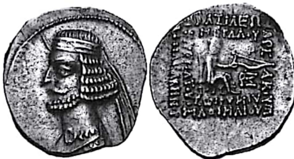
تصویر ۸- سکه مهرداد سوم