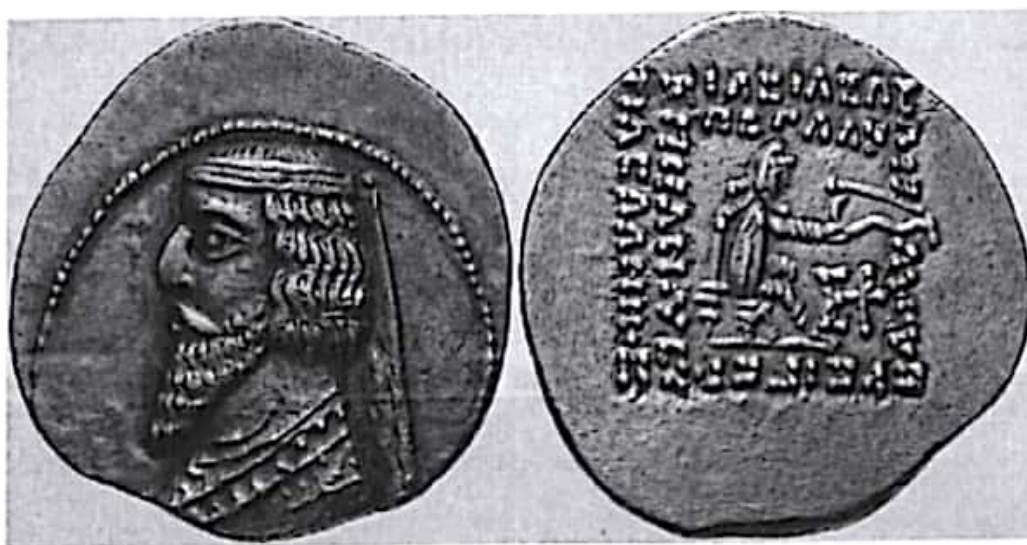
تصویر ۷- سکه فرهاد سوم

پیروز شد و بدین ترتیب، دیگر اتحاد با ایران برای او سودی نداشت. در این زمان تحولات مهمی در روم اتفاق افتاده است. ظاهراً فرهاد پیشنهاد اتحاد با روم را نپذیرفت و صرفاً با تعیین رود فرات به عنوان خط مرزی ایران با غرب موافقت کرد. این که چرا فرهاد بدون کسب امتیازی با چنین پیمانی موافقت کرده برای پژوهشگران روشن نیست. آن چه که شواهد نشان می دهند آن است که در این زمان، روابط ایران و روم رو به تیرگی نهاده بود و دلایل این تیرگی احتمالاً آن بود که روم همواره چشم طمع به ارمنستان داشت و این سرزمین را به عنوان سدی در برابر پارت می خواست. اکنون به این خواست، دست نیافته بود. عامل دیگری که موجب تیرگی روابط ایران و روم شده بود این که پومپئوس، امپراتور روم، لقب شاهنشاه را برای فرهاد نپذیرفته بود و او را صرفاً شاه خطاب می کرد. به هر حال، فرهاد با پذیرش رود فرات به عنوان مرز ایران، سرزمین های بسیاری را تا سوریه از دست داده بود. این مشکلات را تنش های درونی شاهنشاهی نیز دوچندان می کرد. چنان که فرهاد نیز پس از یک دوره کوتاه و پر از آشوب در سال ۵۷-۵۸ (ق م) به وسیله پسران خود، مهرداد و ارد مسموم شد و زندگی را به درود گفت. ظاهراً این گونه نزاع های خانوادگی بر سر قدرت، تأثیری نامطلوب و مخرب در روند شاهنشاهی پارت برجای گذاشت (زرین کوب ۱۳۷۷: ۳۴۴؛ ولسکی ۱۳۸۳: ۱۴۲، ۱۴۴؛ شیپمن ۱۳۸۶: ۷۸؛ دبوواز ۱۹۶۸: ۷۱)