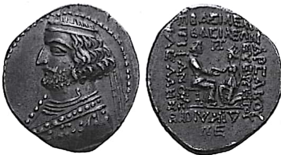
تصویر ۹- سکه ارد دوم

سرانجام، در اواخر دوران حیات ارد، سپاه او سوریه را ترک کرد و بدون کسب امتیازی ارزشمند به ایران بازگشت. درحالی که حاصل این کشمکش‌ها، اختلاف میان ارد و پسرش، پاکور بود. اگرچه مرگ پسر (۳۸ ق م) که چندی بعد به وقوع پیوست آنچنان او را متأثر کرد که دچار اختلال حواس شد و به زودی وفات یافت و تاج و تخت شاهی به فرزند دیگرش فرهاد چهارم رسید (ولسکی ۱۳۸۳: ۱۵۷؛ شیپمن ۱۳۸۶: ۸۷). برخی سکه‌های ارد دوم در زمان پدرش فرهاد سوم ضرب شد و ظاهراً این امری رایج بوده است (نیکیتین ۱۹۹۸: ۱۷)