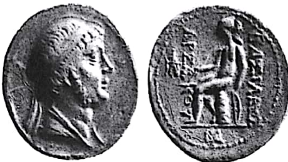
تصویر ۴- سکه فرهاد دوم ضرب شوش

بیشترین نوع سکه‌های فرهاد درهم بود که احتمالاً در ضرابخانه‌های شرق ضرب شده بود. پیش از این اظهار شده بود که هیچ سکه‌ای از فرهاد دوم در سلوکیه یافت نشده است.