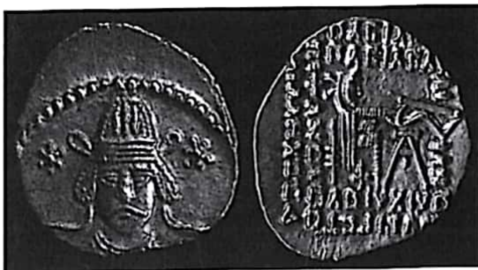
تصویر ۱۶- وُنن دوم

یکی از بستگان دور او را به نام وُنن دوم که زمام فرمانروایی ماد را بر عهده داشت به حکومت نشانند. وُنن دوم سال‌های ۵۱ و ۵۲ م را به آرامی پادشاهی کرد. سپس فرزند او، بلاش یکم زمام امور را به دست گرفت (زرین کوب ۱۳۷۷: ۳۸۰؛ ولسکی ۱۳۸۳: ۱۸۲). شیپمن درباره حکومت دوساله وُنن دوم تردید دارد و بر آن است که به پادشاهی رسیدن چنین شخصی روشن نیست و این موضوع از ابهامات دوران اشکانی به شمار می‌رود (شیپمن ۱۳۸۶: ۱۰۰).