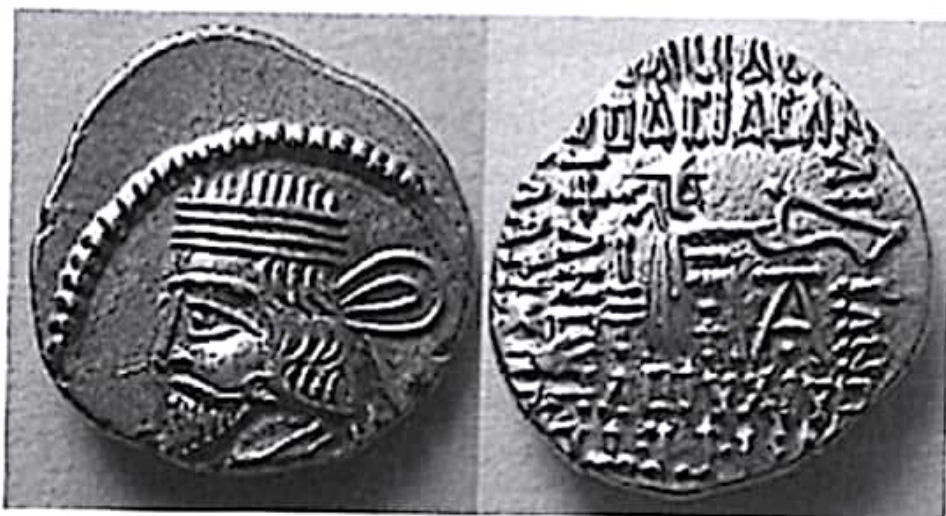
تصویر ۱۴- سکه وردان اول ضرب اکباتان

سکه‌های وردان اول، به‌ویژه آنها که در شرق ضرب شده‌اند، ادامه همان سنت ضرب سکه‌های پدرش را نشان می‌دهند. سکه‌های نقره ضرب شده در بخش غربی شاهنشاهی بهتر باقی مانده‌اند. درهم‌های وردان اول، تنها سه گردنبند بر تاج شاه دارد؛ در حالی که بر تاج وردان دوم پنج گردنبند دیده می‌شود.