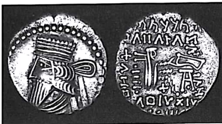
تصویر ۲۵- سکه مهرداد چهارم ضرب اکباتان

کتیبه برنزی هراکلس مکشوفه در ۱۹۸۴ نشان می‌دهد که مهرداد چهارم - مدعی شاهنشاهی اشکانی - پدر بلاش چهارم بود (السلیحی ۱۹۸۴: ۲۱۹).