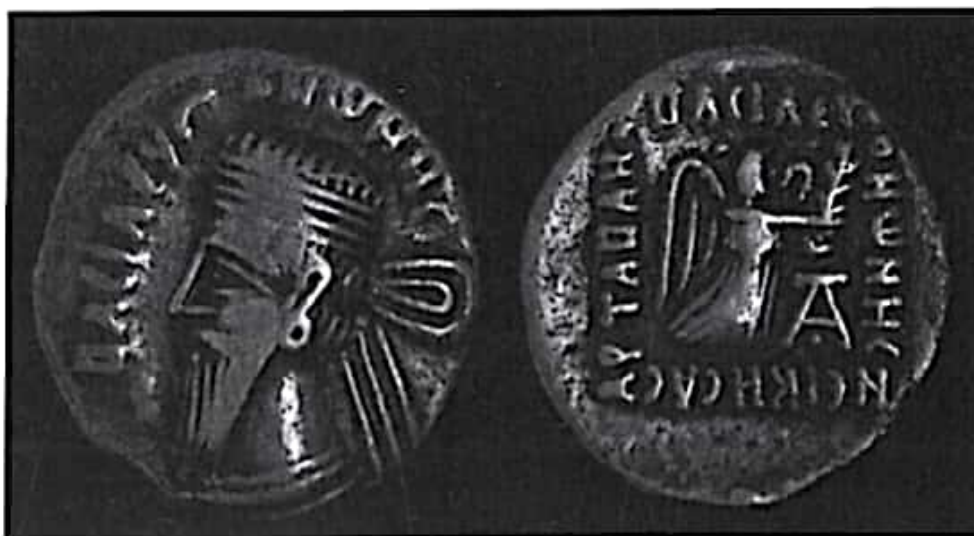
تصویر ۱۲- سکه ونن یکم ضرب اکباتان

چند سال حکومت کرد؛ اما اقامت او در روم و عدم آشنایی او با سنن ایرانی موجب شد تا رفتار او برای نجبا قابل تحمل نباشد. ظاهراً وی رفتاری ساده و به دور از نخوت و تکبر داشت و همین امر موجب شد که حیثیت انجمن مهستان خدشه دار شود. تاسیتوس، تاریخ‌نگار مشهور روم گزارش داده که نجبا از این که یک شاهزاده دست‌نشانده روم را به تخت نشانده بودند، رضایت نداشتند (ولسکی ۱۳۸۳: ۱۶۸؛ زرین کوب، ۱۳۷۷: ۳۷۳؛ شیمن ۱۳۸۶: ۹۴).