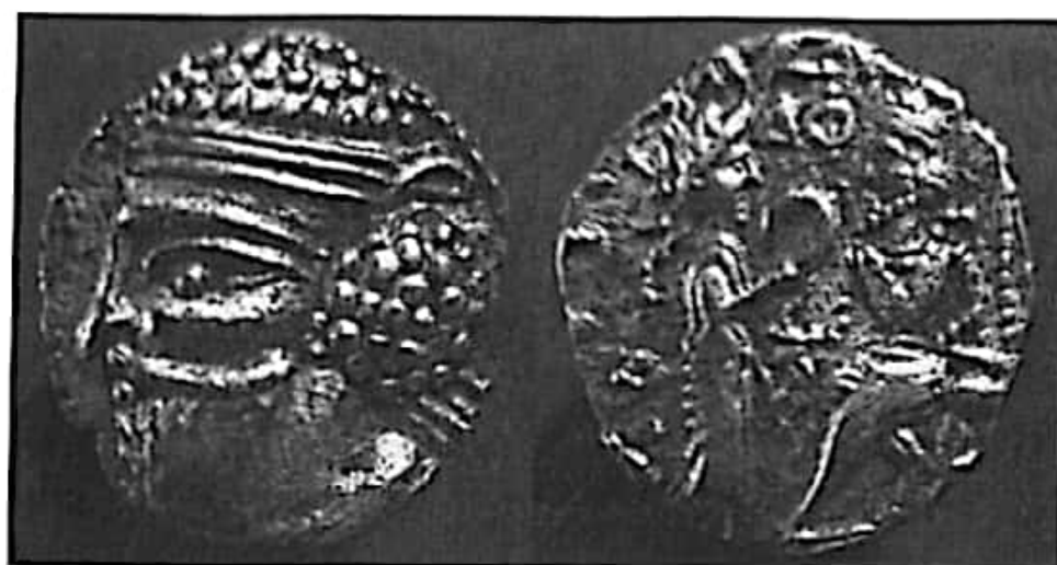
تصویر ۲۹- سکه بلاش پنجم ضرب اکباتان پشت سکه: نیکه مقام شاهی را به بلاش اهدا می‌کند.