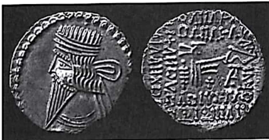
تصویر ۲۴- سکه بلاش سوم

پارسا از مجازات او صرف نظر کرد. آنتونیوس بدون رضایت شاه اشکانی نامزد مورد نظر خود را در ارمنستان بر تخت نشاند (ولسکی ۱۳۸۳: ۲۰۵-۲۰۶؛ برای پاره‌ای تفاوت‌ها که تا پایان دوران اشکانی ادامه دارد نک: زرین کوب ۱۳۷۷: ۳۹۸ بی).