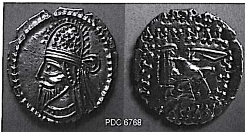
تصویر ۳۱- سکه اردوان چهارم ضرب اکباتان

آخرین برخوردهای ایران و روم نشان می‌دهد که اردوان از قدرتی قابل توجه برخوردار بوده است هرچند که جنگ‌های داخلی موجب نابودی پارتیان شد. شواهد نشان می‌دهد که حتی مجلس نجبا و اشراف پارت نیز از این همه جنگ و ستیز داخلی خسته و بیزار بودند، زیرا هنگامی که با شورش تازه‌ای که توسط اردشیر و پدرش بابک علیه شاهان محلی در پارس ایجاد شده بود، مواجه شدند؛ هیچ‌گونه واکنشی به سود اردوان نشان ندادند و حتی پنهانی به دشمن نیز یاری رسانیدند (ولسکی ۱۳۸۳: ۲۰۸ تا ۲۱۵؛ زرین کوب ۱۳۷۷: ۴۰۵).