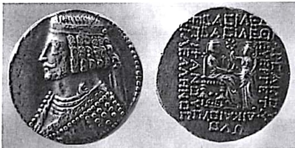
تصویر ۱۰- فرهاد چهارم

صورت گرفته است. به هر حال این اقدام نتیجه‌ای نداشت و نزد رومی‌ها این گونه تلقی شد که گویی فرهاد آنها را به نشانه وفاداری خویش فرستاده بود. در این میان مرگ فرهاد که ظاهراً با رضایت فرهادک و به دست موزا صورت گرفت، به همه این ماجراها خاتمه داد (زرین کوب ۱۳۷۷: ۳۷۲؛ شیپمن ۱۳۸۶: ۹۳).