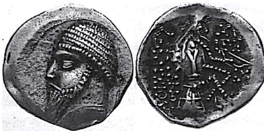
تصویر ۵- اردوان اول

افزون بر این، تاریخ‌نگاران از این زمان به بعد نام یک سلسله شاهان را که همراه با پارتیان به‌طور مشترک در هند فرمان می‌راندند، به کمک سکه‌های مکشوفه استخراج کرده‌اند. براین اساس می‌توان این‌گونه استنباط کرد که در سازمان شاهان هند و سکایی و ارتباط آنها با ملوک الطوائف و امرای محلی جنوب شرقی ایران، به‌طور عادی سه حکمران معاصر با یکدیگر با عنوان شاهی در ایران و شمال غربی هند فرمان می‌راندند.