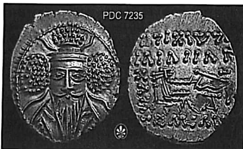
تصویر ۲۸- سکه بلاش پنجم

بزرگان بود تا در صورت نیاز بتواند از امکانات آنها بهره‌مند شود. همین رویه به تدریج موجب تضعیف قدرت شاه و تقویت نیروهای محلی شده بود. دشمنی شاهزادگان اشکانی بر سر کسب قدرت و شاهنشاهی و درنهایت بی‌تدبیری برخی شاهان اشکانی از عوامل دیگر در جهت نابودی آنها بود. ظاهراً همین عوامل سبب شد که ساسانیان بتوانند به آسانی پیکره این شاهنشاهی را در هم بشکنند (ولسکی ۱۳۸۳: ۲۰۹).