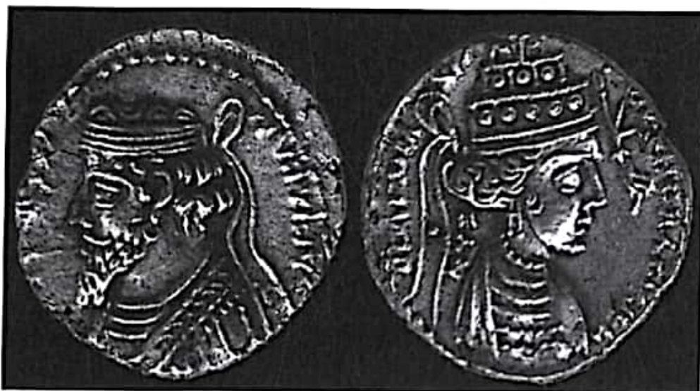
تصویر ۱۱- فرهاد چهارم و ملکه موزا