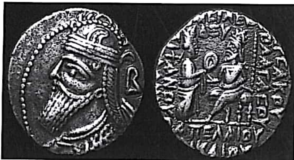
تصویر ۲۷- سکه بلاش چهارم

بلاش چهارم فرصتی برای تجدید جنگ و استرداد آن چند شهر را نیافت. وی پس از وفات جای خود را به بلاش پنجم داد (ولسکی ۱۳۸۳: ۲۰۷-۲۰۸؛ زرین کوب ۱۳۷۷: ۴۰۲ ب). ۱