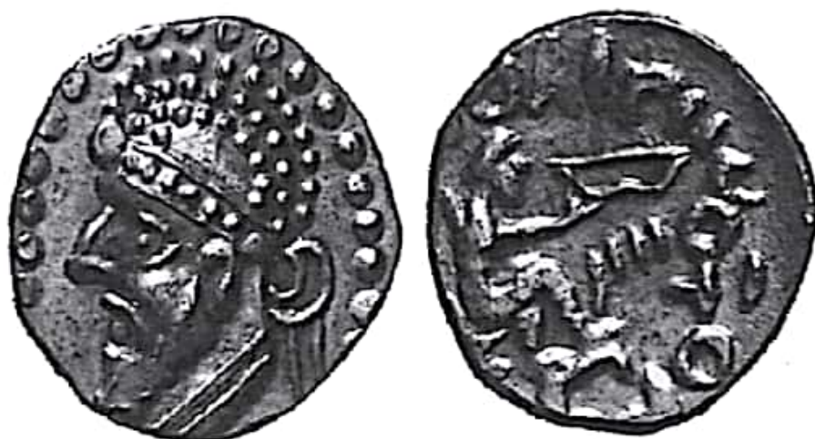
تصویر ۱۹- بلاش دوم ۱ (فرمانروایی ۷۷-۸۰ م؟)

پس از مرگ بلاش یکم، دوران تازه‌ای در تاریخ اشکانیان پدید آمد. آگاهی ما از تاریخ شاهنشاهی اشکانی، به‌ویژه پس از فرمانروایی بلاش یکم بسیار ناچیز بلکه کاملاً مبهم است. شاید علت این امر سکوت طولانی تاریخ‌نگاران رومی درباره این دوران است. این سکوت به‌واسطه آن است که در این ایام میان ایران و روم صلحی پایدار و طولانی برقرار بود؛ اما به‌نظر می‌رسد وجود این صلح مایه آرامش در خاندان اشکانی نبوده، برعکس نزاعی داخلی میان خاندان شاهنشاهی و اعضای مجلس نجبا جریان داشته است. نزاعی که سرانجام مایه سقوط شاهنشاهی عظیم اشکانی شد (زرین کوب ۱۳۷۷: ۳۹۵). پاکور دوم که در همان دوران بلاش مدعی پادشاهی بود؛ اینک با اردوان سوم بر سر تاج و تخت اشکانی در نزاع بود. به‌واسطه همین درگیری‌ها، اندیشه دخالت‌های نابه‌جا و سرانجام نابودی فرمانروایی اشکانی در ذهن رومیان شکل گرفت. به‌طوری که در حدود ده‌سال بعد نقشه نابودی اشکانیان از سوی تراپانوس به اجرا درآمد. شواهد باستان‌شناسی نشان می‌دهند که رومی‌ها در مرزهای شرقی خود لوازم حمله به ایران را فراهم می‌کردند (ولسکی ۱۳۸۳: ۱۹۷-۱۹۸).