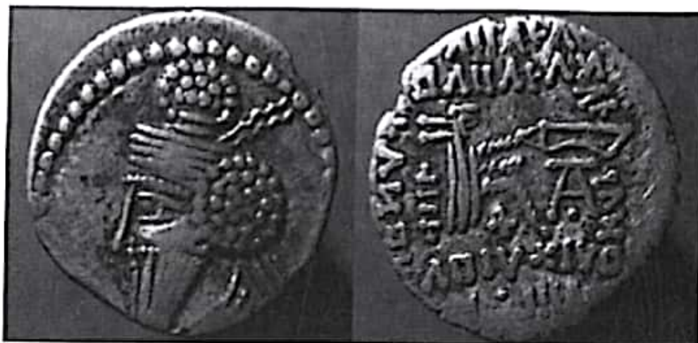
تصویر ۲۳- سکه خسرو اول