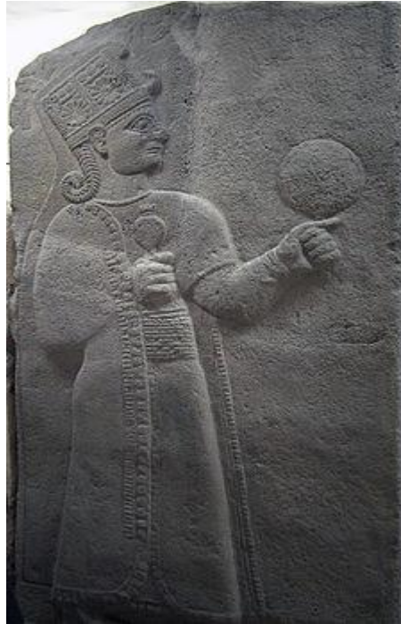
Kububa, holding a pomegranate or a poppy capsule in her right hand and a mirror in her left Museum of Anatolian Civilizations, Ankara, Turkey