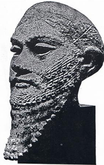
۱۵۰ مجسمه سر، تصویر از پادشاهان کیان [1]، از موزه. کارستانهای آکدی با بعلانی، پایان هزاره سوم قبل از میلاد [2]