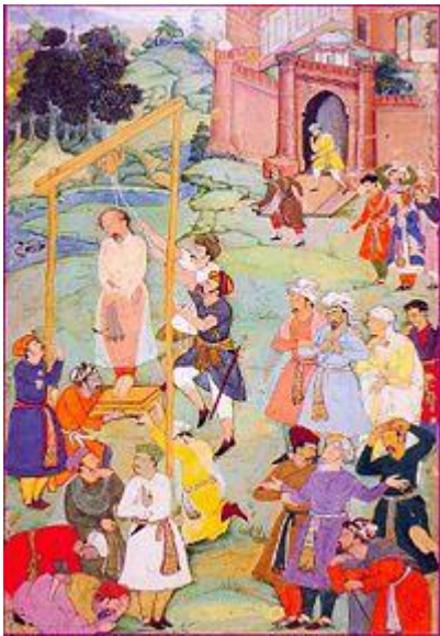
اعدام مانی/منصور حلاج