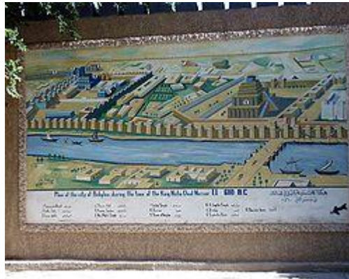
تصویری بازسازی شده از شهر بابل عهد باستان

همه جاي شادي و آرام و مهر كه گفتي ستاره بخواهد بود كه جاي بزرگي و جاي بهاست برآرد چنين برز جاي از مغاك مگر راز دارد يكي در نهان شتابيدن آيد بروز درنگ عنان باره ي تيزتك را سپرد كه پيش نگهبان ايوان برست تو گفتي همي برنوردد زمين فريدون جهان آفرين را بخواند.