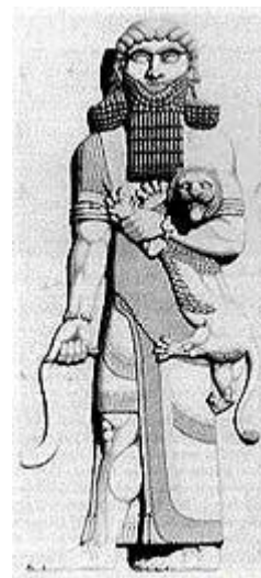
چهره‌ی انسانی گیل‌گمش

افسانه‌ی درخت «هولوپو» از نخستین افسانه‌هایی است که به داستان کاشت درخت می‌پردازد. «زن» در این داستان نقشی اساسی دارد. در باره‌ی درخت هولوپو نظرات مختلفی وجود دارد. برخی آن را درخت بید، برخی درخت سرو و برخی آن را درخت نخل می‌دانند، اما همه بر این باورند که این درخت میوه‌دار زنده و نیاز دیگری انسان را به کشت درخت و می‌دارد.