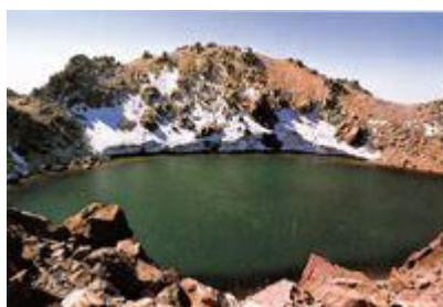
دریاچه کوه سبلان بر فراز قله آن

طایفه گور ، گلوور و گوران که اکنون به صورت فرقه علی الهی در آمده اند در اساس آلوهی بوده اند و بازماندگان همان قبیله مادی مغان عهد باستان می باشند که زرتشت (گائوماتای مغ، بردیه) از میان ایشان بر خاسته بود.