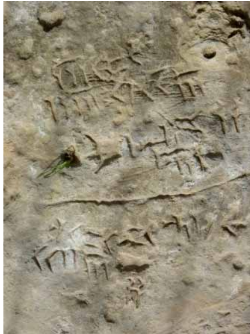
سنگ‌نبشته خارک عکس از: ر. م. غیاث آبادی، اسفند ۱۳۸۶

نداشته و از آن بهره‌ای نبرده است. در پیرامون صخره، نشان‌های میخی دیگر که گاه بسیار محو و ناخوانا هستند، دیده می‌شود.