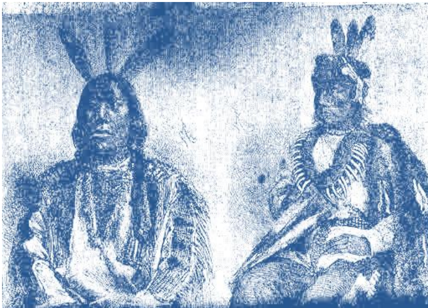
دو تن از هندیان آمریکای شمالی

چنانکه گفتیم در روزهای جنگ ، مونتیزوما پادشاه مکزیک چند روزی خوراک نخورده خود را کشت. پس از بیرون آمدن کورتیز و همراهانش کار نخست برگزیدن جانشین او بود. باید دانست پادشاهی در مکزیک ارثی نبوده انتخابی بود. پادشاه را بزرگان کشور یا سران تیره‌ها برمی‌گزیدند. در این هنگام نیز بزرگان نامبرده فراهم آمده کوتیلاواگا برادر پادشاه درگذشته را برگزیدند.