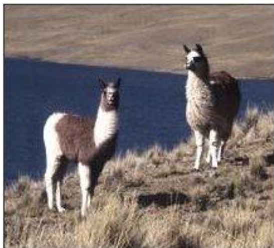
لاما – بیکره از ویراینده

برای نخست بار چارپای خانگی در آمریکا می‌دیدند. لاما که باید آن را شتر کوچک نامید در میانشان فراوان بود که بار بیشت آنها می‌نهادند.