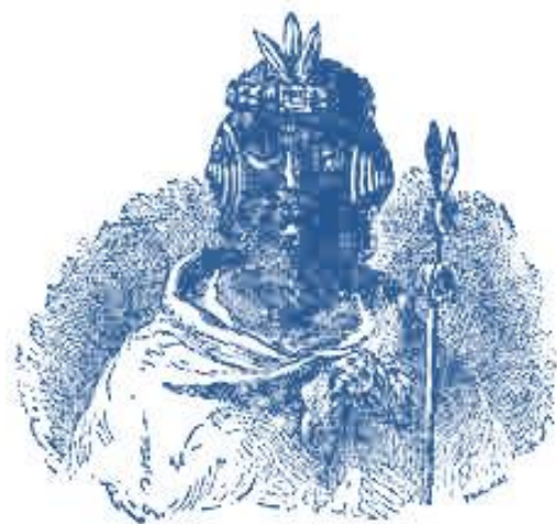
للوک یو پانکوی