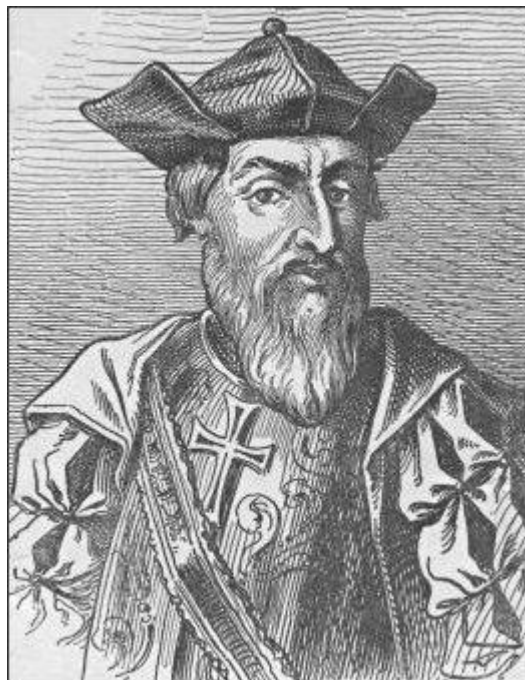
واسکو دوگاما - پیکره از ویراینده

پس از جون ، امانوئیل نامی پادشاه شده و او همچون پیشینیان خود دانش‌دوست بود و بکشفهای جغرافیایی ارج می‌گذاشت. از اینرو در سال ۱۴۹۷ یکی از کشتیرانان آزموده و بنام پرتغال را که واسکودوکاما بود برگزیده سه تا کشتی در اختیار او گذاشت که راه بارتولومودیاز را پیش گرفته از آن راه خود را به هندوستان رساند. واسکو دوگاما در نهم ماه می ۱۴۹۷ از پرتغال روانه گردید. ولی چون کشتیهای او کوچک و همچون دیگر کشتیهای آن زمان بدساخت بود ، و از آنسو در آن زمان اروپاییها باین دریاها آشنا نبوده زمان بادهای سازگار و ناسازگار را نمی‌شناختند و هنگامی که برای این سفر برگزیده شده بود بدترین زمان سال بود - در نتیجهی اینها دوگاما دچار دشواریهای بسیار گردیده چهارماه درست کشید تا توانست خود را بدماغهی امید نیک رساند ، و چند روز در آنجا درنگ کرده روز بیستم نومبر که هوا کمی آرامش یافته بود از آنجا روانه گردیده پس از دشواریهای دیگری که دوباره دچار شد خود را بشهر مالیندا رسانید.