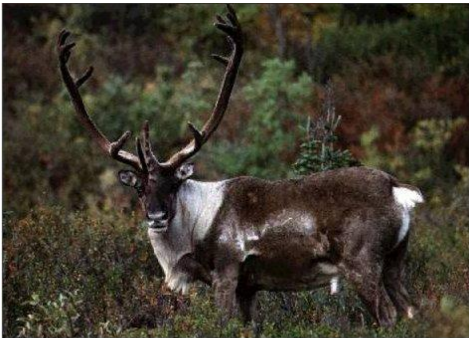
گوزن آمریکایی - پیکره از ویراینده

همان روز دلیلها ۱ کوهی را نشان داده گفتند : «اگر ببالای این کوه رسیم آن دریا پیداست.» از این مژده همه نیرو یافته کوه را به بالا رفتن آغازیدند ، و چون به نیمه‌ی راه رسیدند بالبوآ که می‌خواست پیدا کننده‌ی آن دریا خودش تنها باشد دستور داد همراهان در آنجا ایستاده بیاسایند ، و خود دامن مردانگی بکمر زد با تنهایی کوه را بالا رفت ، و چون ببالای آن رسیده نگاه کرد دریایی دید بیکران ، و از بس شادمان و خرسند بود بی‌اختیار زانو بزمین نهاده بخدا سپاسها گزارد. همراهانش از دور چون حال او را دیدند تاب شکیبایی نیاورده بالا شتافتند و دریا را تماشا کرده شادمانی و سپاسگزاری نمودند. پس از آن چهار روز دیگر گذشت تا از کوه پایین رفته خود را بکنار دریا رسانیدند. بالبوآ به یک دست شمشیر و بدست دیگر سپر گرفته تا سینه بدرون آب رفت و آن دریا را با هرچه در آنست بنام پادشاه اسپانیا تصرف کرد. آن نقطه از دریا در شرق پاناما است که بالبوآ «سانت میچل» نام نهاد (و تا کنون با همان نام بازمانده).