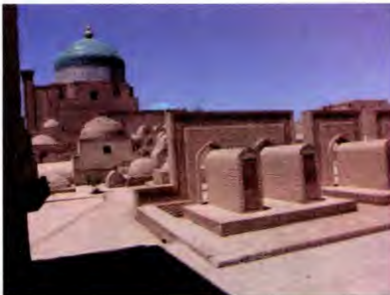
آرامگاه پوریای ولی