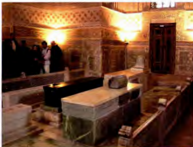
نمای داخلی مقبره امیر تیمور در سمرقند