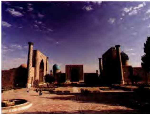
میدان ریگستان در سمرقند