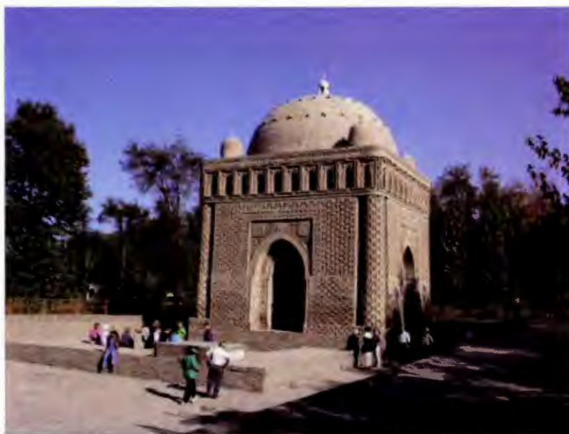
آرامگاه امیر اسماعیل سامانی