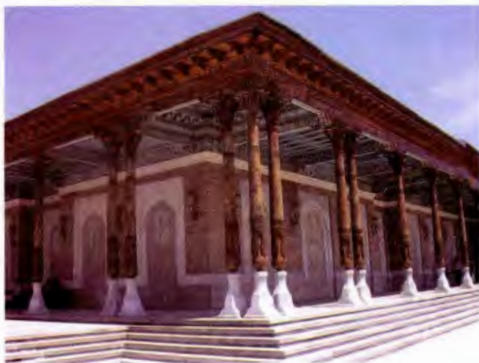
مسجدی در سمرقند