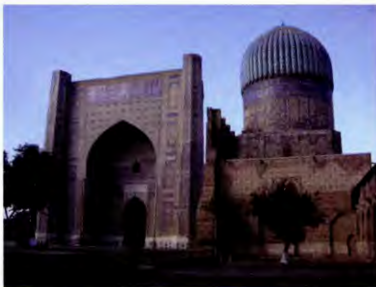
مسجد بی بی خانم در سمرقند