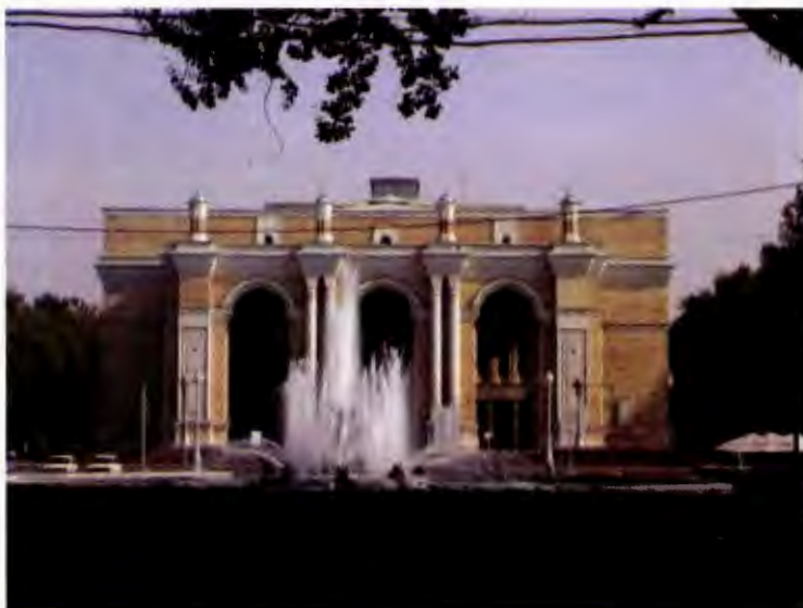
تئاتر علیشیر نوایی در تاشکند