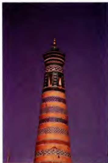
مناره زیبایی در بخارا