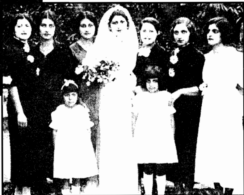
ساتی نفر اول سمت راست، به عنوان بساقدوش عروس، عروسی جیبی ۱۹۳۵