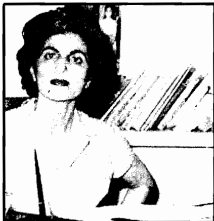
پشت میز کارش، در سال های نخست مدرسه ی مددکاری اجتماعی تهران