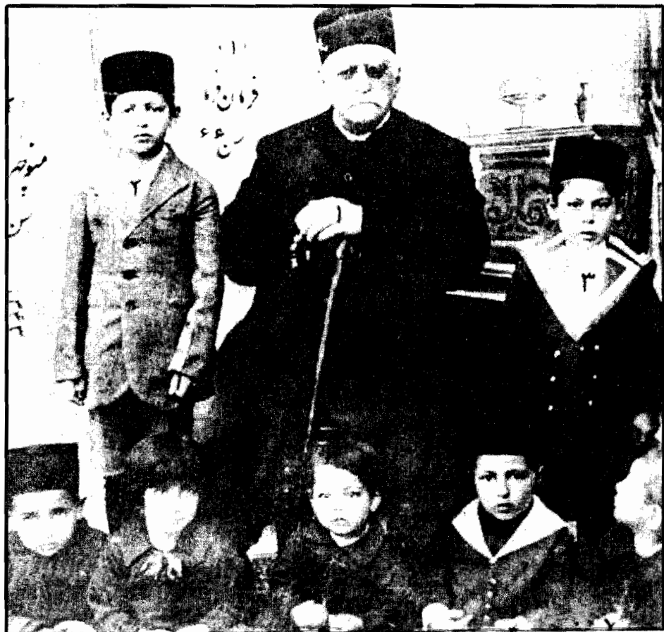
شازده در ۶۶ سالگی با ساتی (ردیف جلو، نفر دوم از سمت چپ) و عده‌ای از برادران‌اش در یکی از بازدیدهای روز جمعه در اطاق شازده