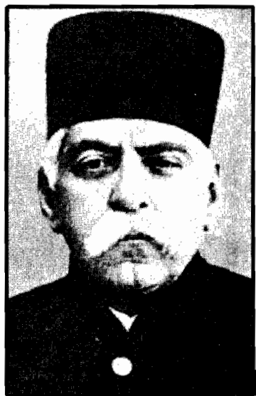
شازده در ۵۷ سالگی به عنوان استاندار استان فارس در خلال جنگ جهانی اول