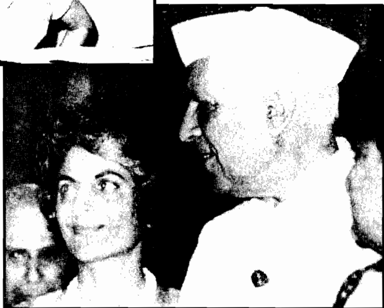
همراه جواهر لعل نهرو، به عنوان مهمان دار ۱۹۶۲