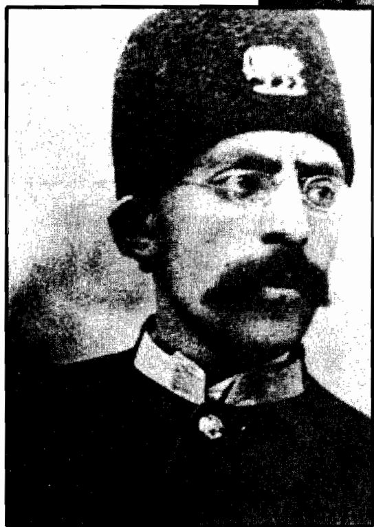
شازده به عنوان افسر اکادمی نظامی اتریشی ها ، تهران .