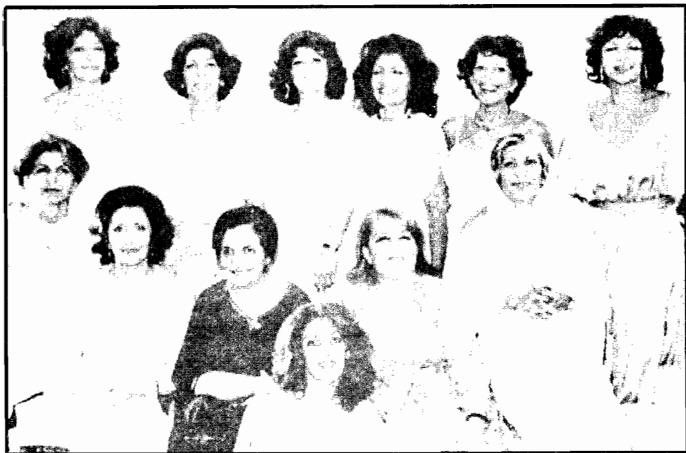
ساتی و یازده خواهرش