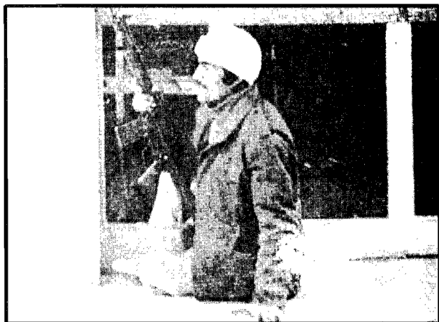
دسامبر ۱۹۷۷: انقلابیونی که با زور وارد مدرسه شدند.