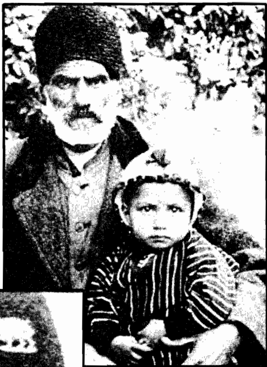
آقاچون پدیر بزرگ مادری ساتی