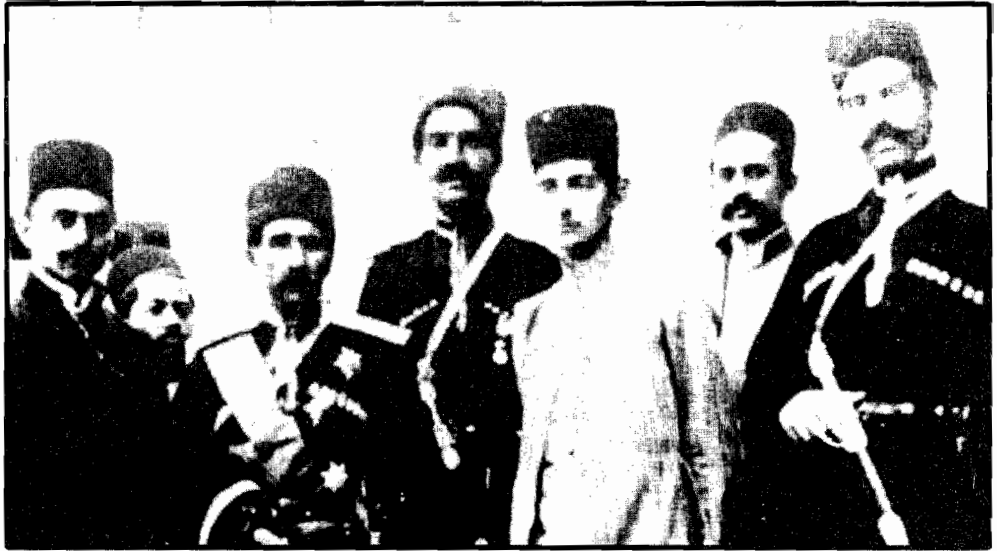
عده‌ای از افسران نظامی شانزده حدود سال ۱۹۰۷