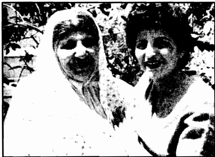
ساتی و مادرش در باغ منزل خانم