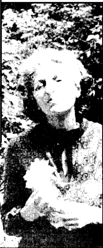
رضوانیه: باغ و گلستان صبار آخرین دیدار.