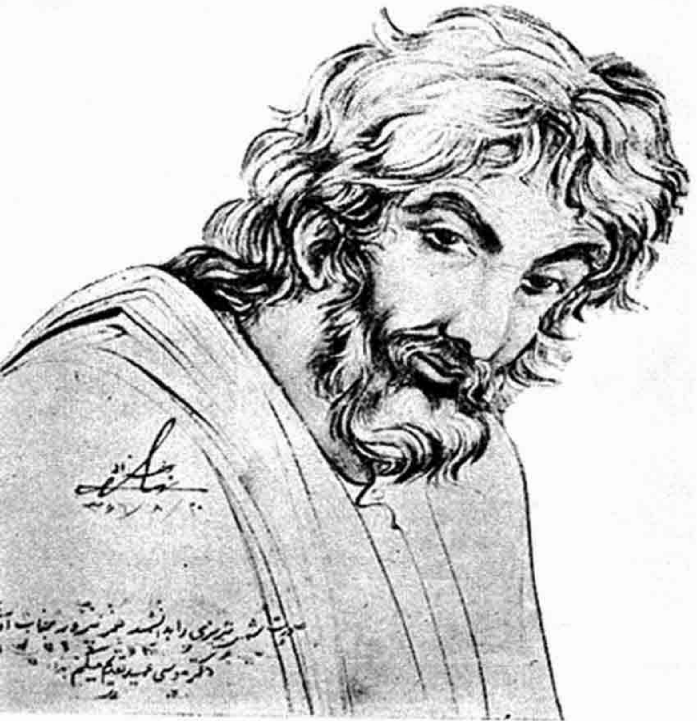
تصویری از شمس به قلم استاد حسین بهزاد (۱۳۴۷-۱۲۷۳ ش / ۱۹۶۸-۱۸۹۴ م)