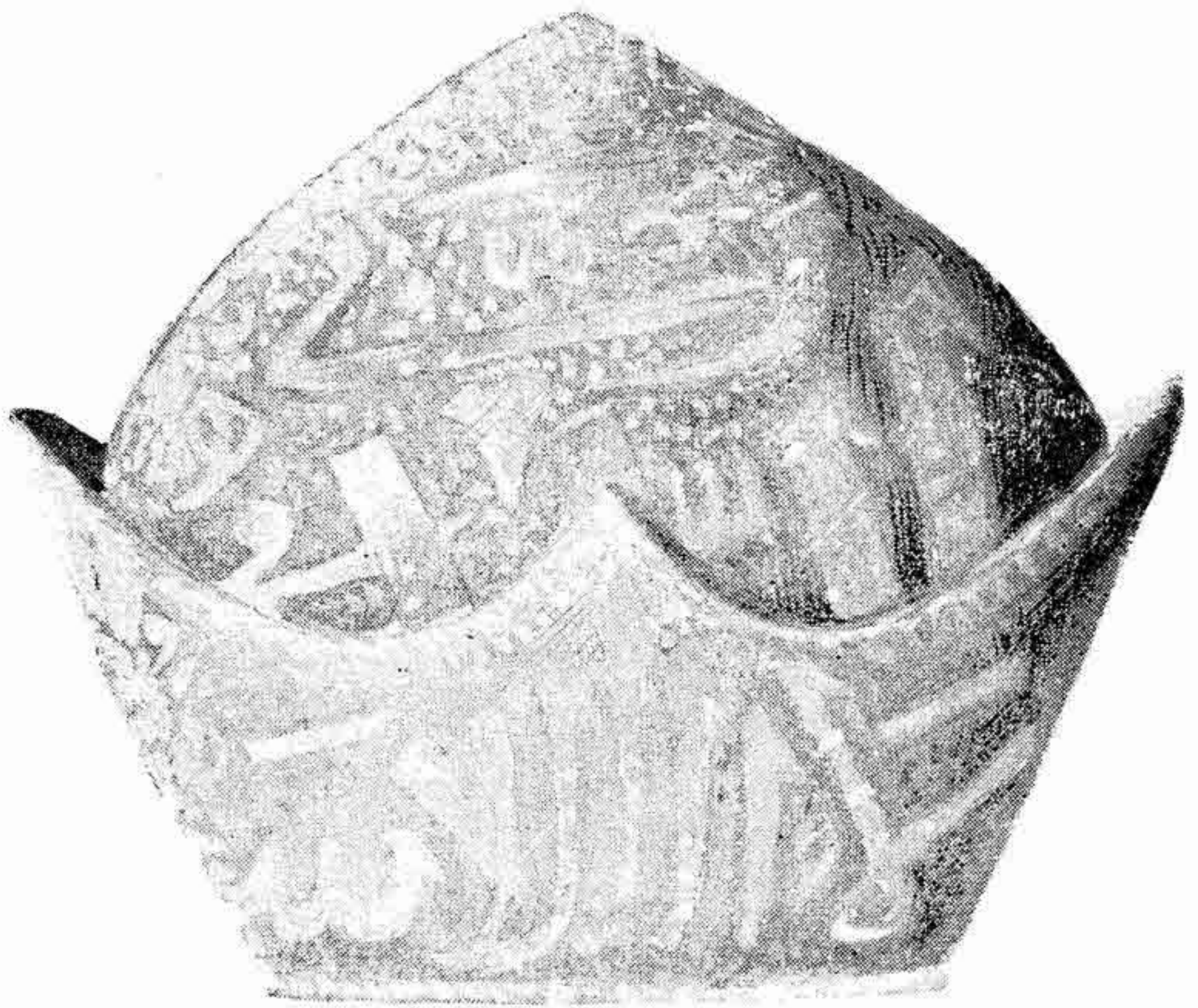
کلاه منسوب به شمس تبریزی محفوظ در موزه قونیه