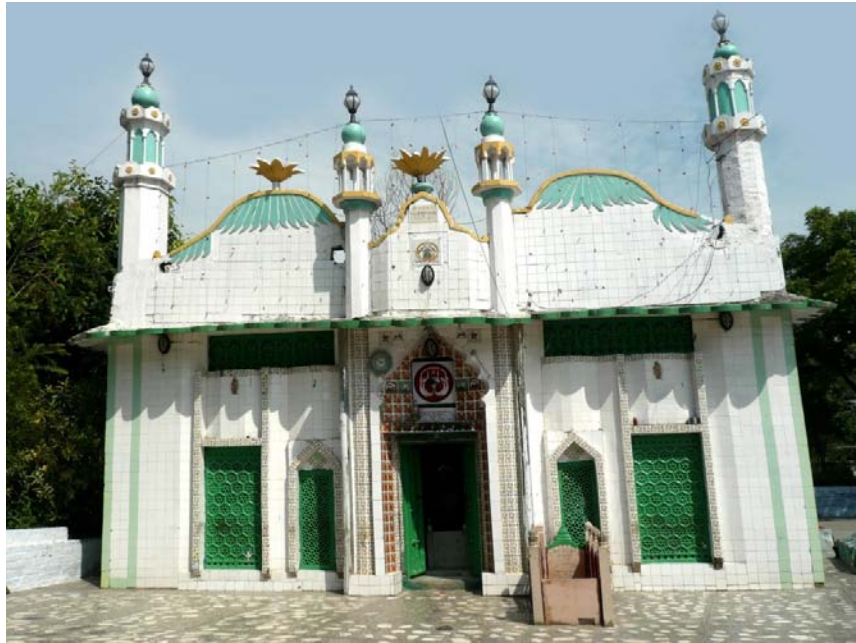
زيارت گاه حضرت شاه جمال كولوى - عليگر (هند)